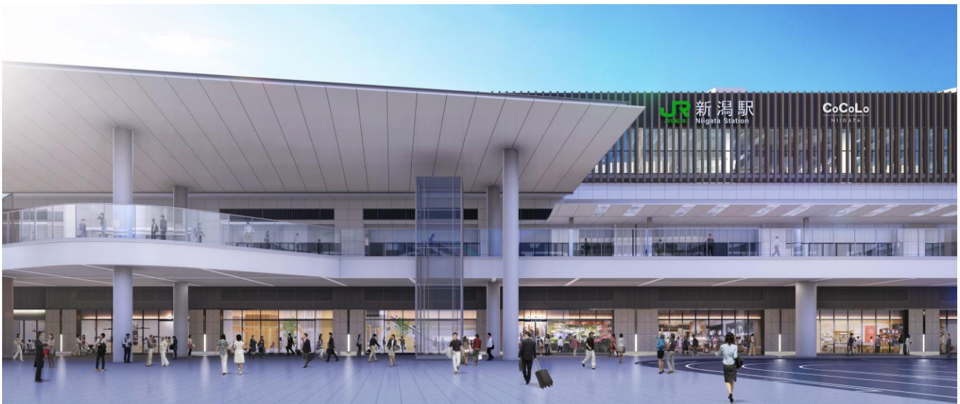
新潟駅万代広場側イメージパース