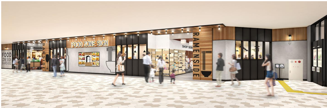
横丁(外観)イメージパース