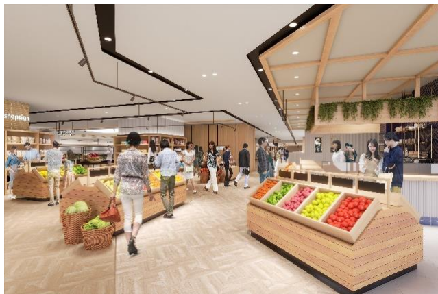
生鮮食料品売り場イメージパース

地元新潟の食材を多く取り扱う青果・精肉・鮮魚、グロッサリーが集まった生鮮食料品売り場のほか、素材にこだわった惣菜専門店や地元産直ショップも揃う食品ゾーンです。