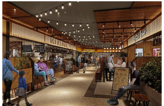
横丁イメージパース

エスニック酒場、ハイボール酒場などカテゴリ分けされた小型のバル6店舗が揃う『バルエリア』と、新潟を代表する人気ラーメン5店舗が集まる『ラーメンエリア』。駅で気軽に立ち寄れるにぎやかな“横丁”ゾーンです。