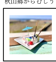
レインボーチーズケーキ