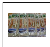
秋山郷からむしうどん