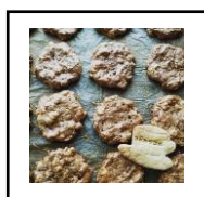
ミューズリークッキー