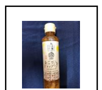
あごダシドレッシング