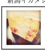
酒粕パウンドケーキ